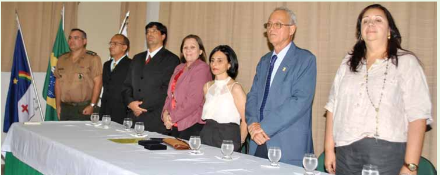
Conselho de Medicina Veterinária realiza campanha de combate ao tráfico de animais selvagens pag. 7

Trazer o público que está mais distante da capital para participar das atividades e discussões da semana dedicada ao médico veterinário foi uma das metas do Conselho Regional de Medicina Veterinária.