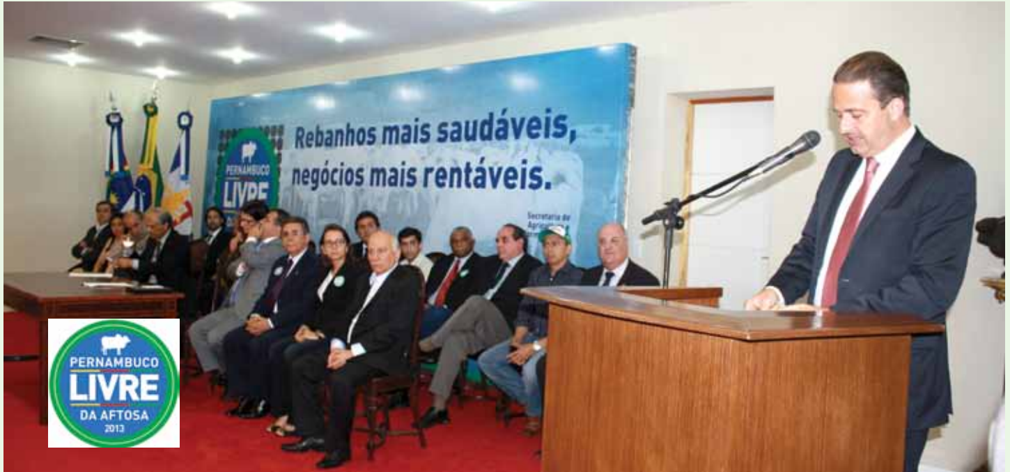
Governador Eduardo Campos discursando durante cerimônia que declarou a mudança de status sanitária de Pernambuco

Mais sete estados também mudam de status