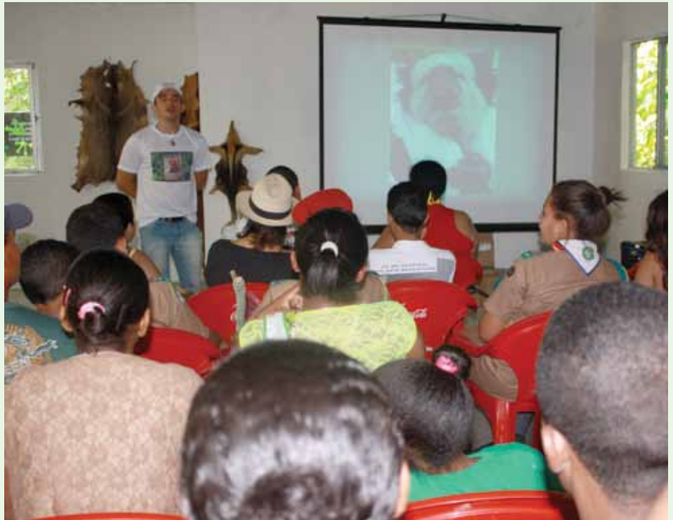
Apresentação teatral sobre o tráfico de animais selvagens

Em Pernambuco 90% dos animais traficados são aves, as mais comuns são o papa capim, galo de campina, patativa e o papagaio (esse para criação doméstica). Além disso, muitas pessoas criam animais selvagens em casa como se fossem domésticos e não compreendem o mal que fazem. Se os animais forem comprados de forma ilegal, as pessoas que os criam são também consideradas traficantes e devem arcar com as